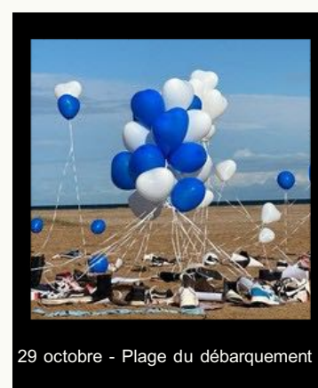
29 octobre - Plage du débarquement