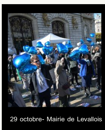
29 octobre - Mairie de Levallois