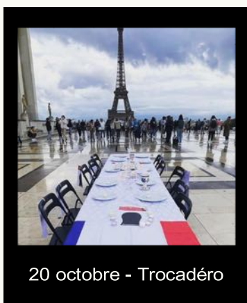
20 octobre - Trocadéro