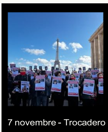
7 novembre - Trocadero